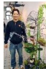
Exposição Weiss Blumen